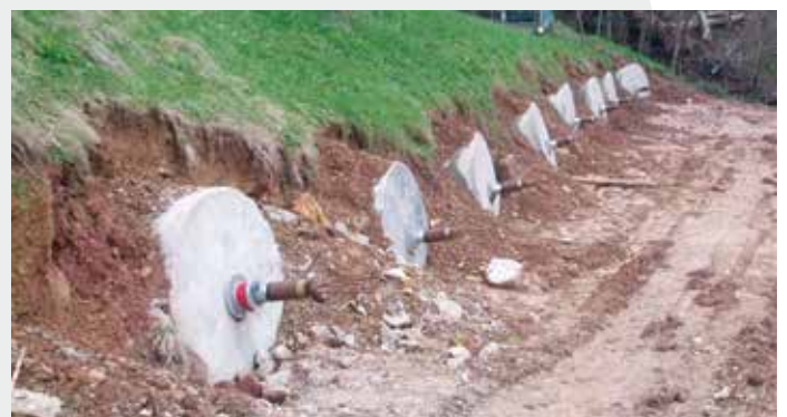
<< Frana Cischele Recoaro Terme - Ancoraggi composti da 3200 kN << Cischele Recoaro Terme landslide - 3200 kN composite anchors

Sono inoltre conclusi il dottorato di ricerca stipulato con l'Università di Padova e lo studio finanziato dalla Comunità Europea per l'Ancoraggio Flottante Sirive® in partnership con professionisti, l'University of Agriculture di Cracovia (Polonia) e Regione Veneto.