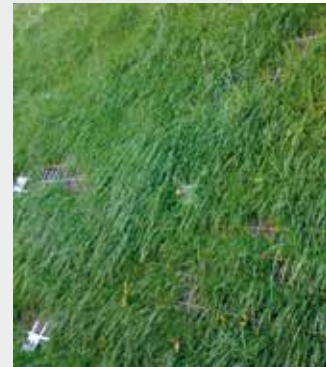
<< "Sirive-1 ® " - "Soft Facing"