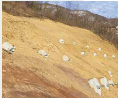
<< Frana Val Maso - Ancoraggi composti da 2000 kN << Val Maso landslide - 2000 kN composite anchors