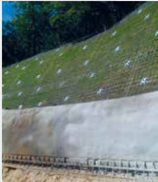
<< "Soft Facing" + "Hard Facing"