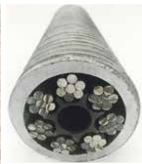
<< Ancoraggi Flottanti realizzati con unità di perforazione a rotopercolazione esterna della lunghezza di 55 m. Ancoraggio composito ø76 mm, bit ø140 mm, forza massima 3200 kN. << Floating anchor produced with a 55 m-long external rotary percussion drilling unit. Composite anchor ø76 mm, bit ø140 mm, maximum strength 3200 kN.