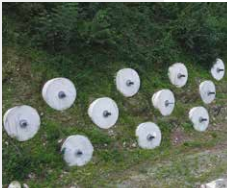
<< Frana Valli del Pasubio - Ancoraggi composti da 2000 kN << Valli del Pasubio landslide - 2000 kN composite anchors

An energy absorber has been studied and validated with the University of Padua to be inserted into complex movement landslides, with the ability to retain a certain design strength, letting the excess pass by, avoiding collapse as would occur with a traditional rigid work.