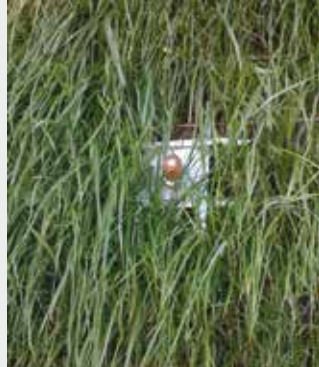
<< "Sirive-1 ® " - "Soft Facing"