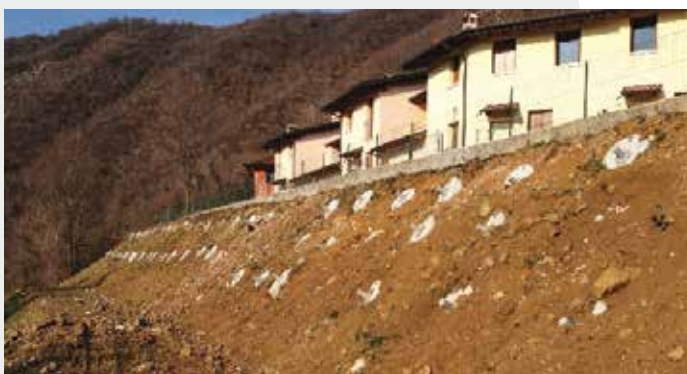
<< Frana Via Monte Cornedo V.no - Ancoraggi composti da 1000 kN << Via Monte Cornedo V.no landslide - 1000 kN composite anchors