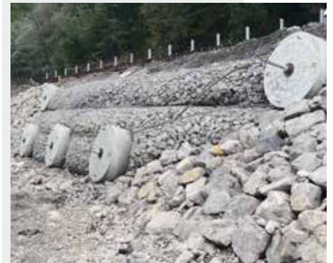
<< Frana Ochojno (Polonia) - Ancoraggi composti da 2400 kN << Ochojno landslide (Poland) - 2400 kN composite anchors